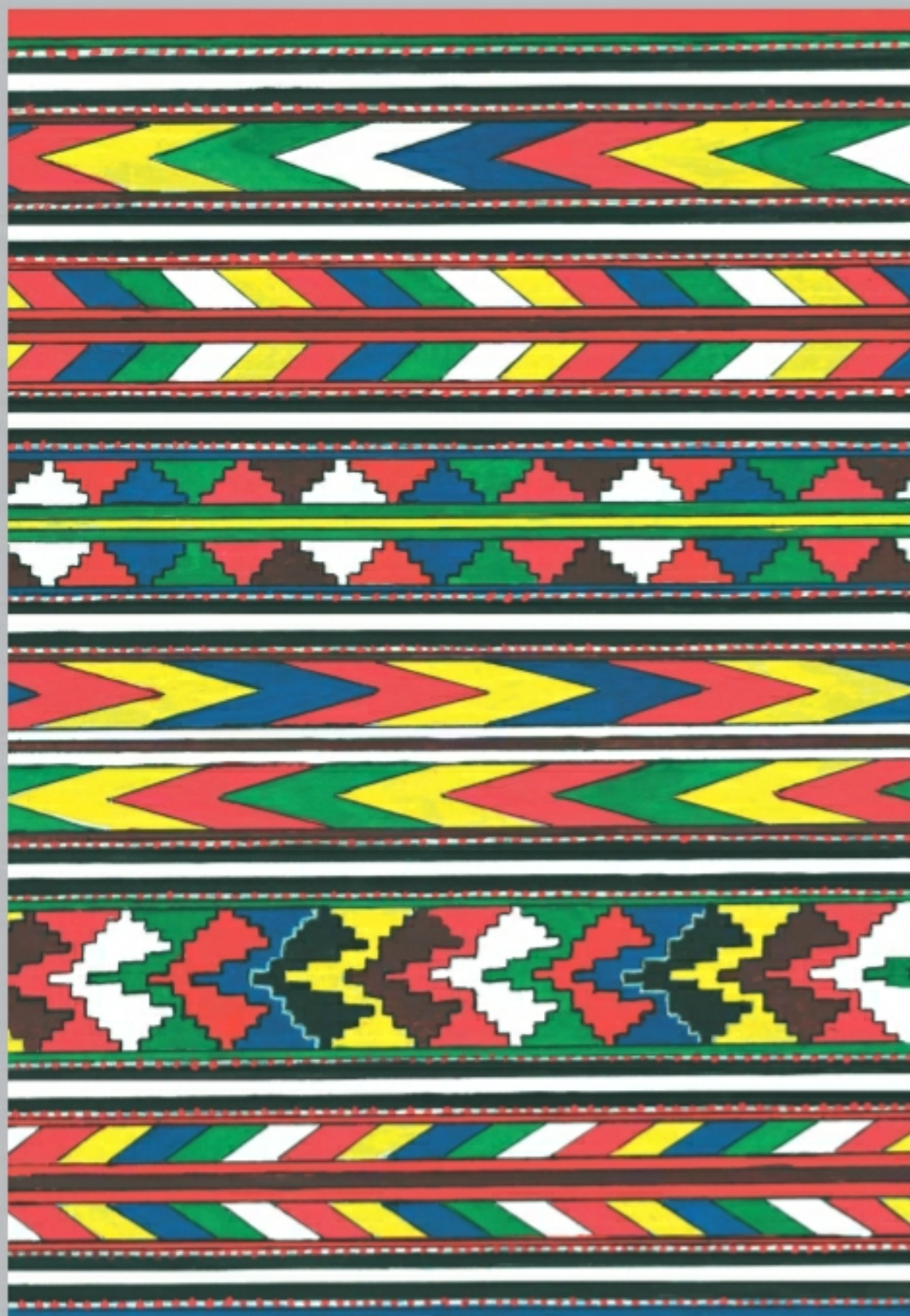
Каякентский ковер-палас IV группы (фрагмент ковра-паласа). Выполнен Кайханум Сельдеровой в 1963 году (рис. Исаева И.Г. с образца)