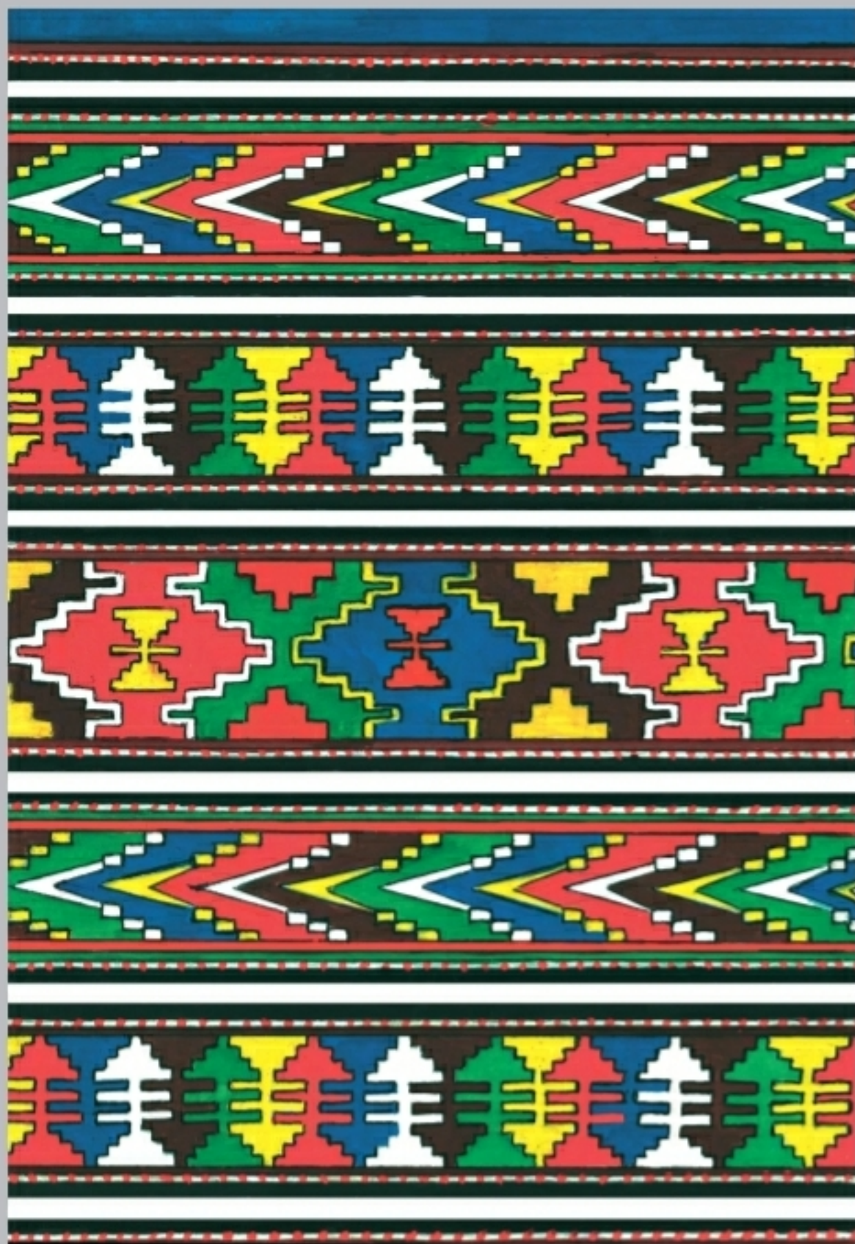
Каякентский ковер-палас III группы (фрагмент ковра-паласа). Выполнен Арув Исаевой в 1957 году (рис. Исаева И.Г. с образца)