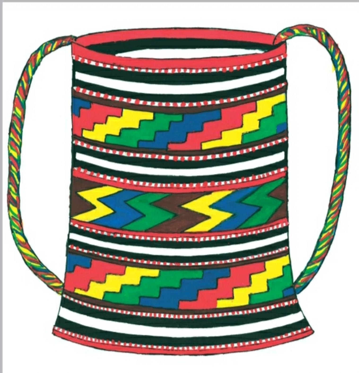
Переметная сумка-торба V группы, размер 60x45 см. Выполнен Айханум Магомедовой в 1910 году (рис. Исаева И.Г. с образца)