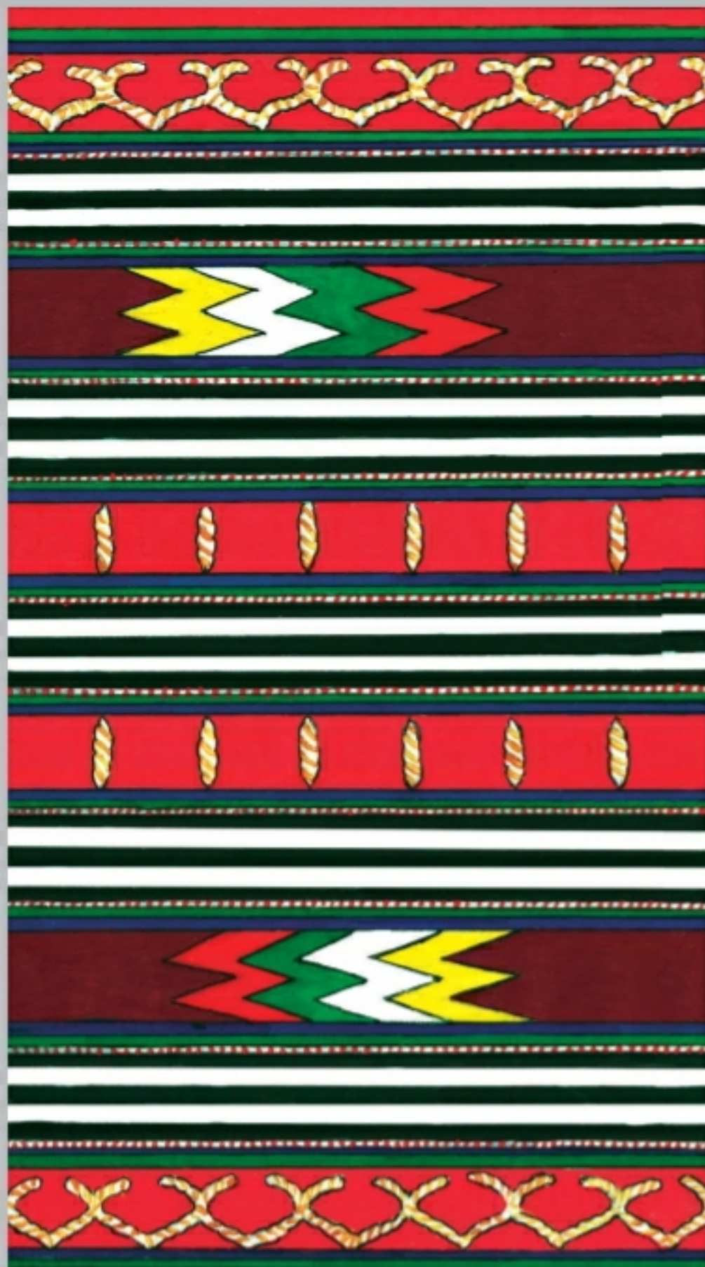
Каякентский ковер-палас II группы. Выполнен в конце XIX века Абидат Магомедовой (рис. Исаева И.Г. с образца)