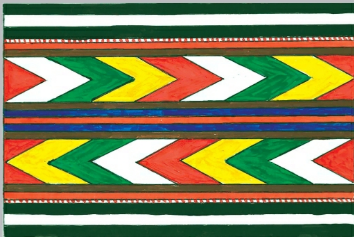
Орнаментальные мотивы узорчатых полос («такъта») (рис. Исаева И. Г.)