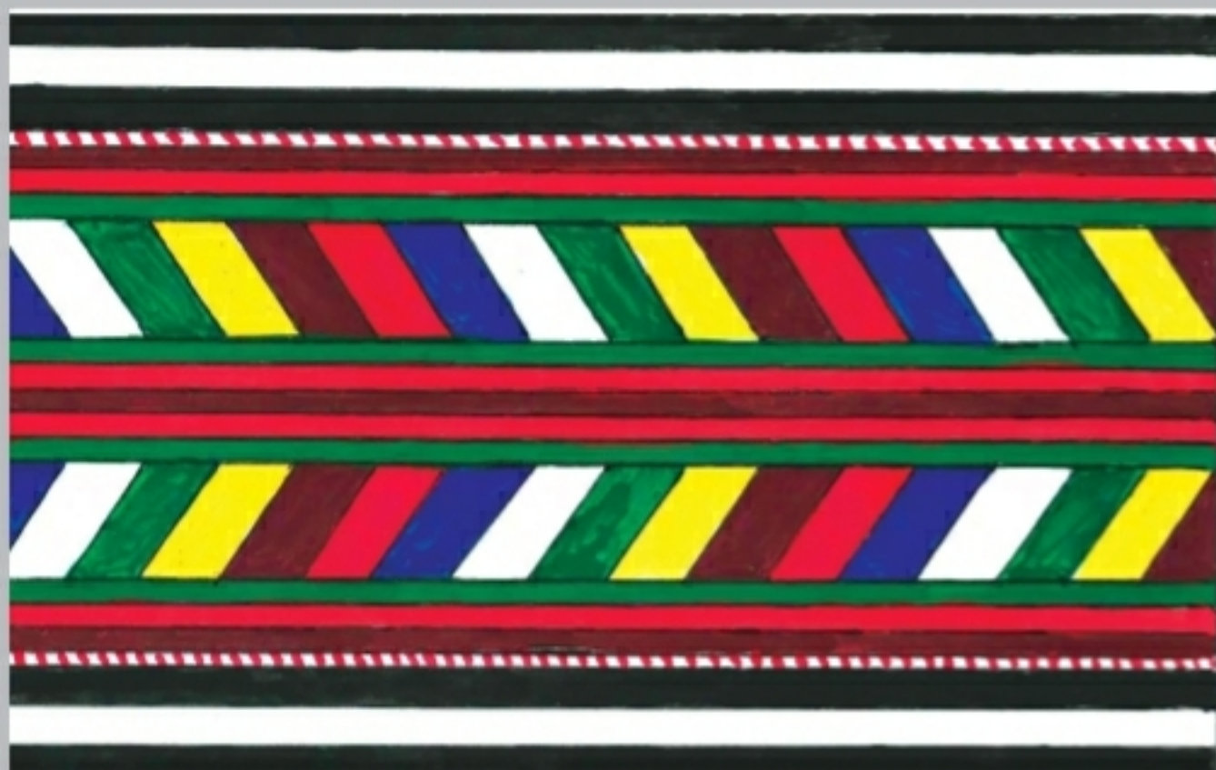
Орнаментальные мотивы узорчатых полос («такъта») (рис. Исаева И. Г.)