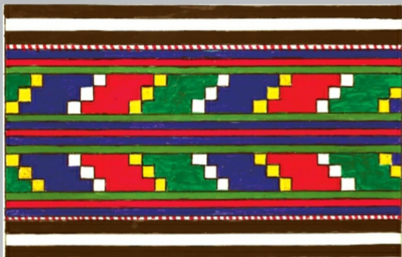
Орнаментальные мотивы узорчатых полос («такъта») (рис. Исаева И. Г.)